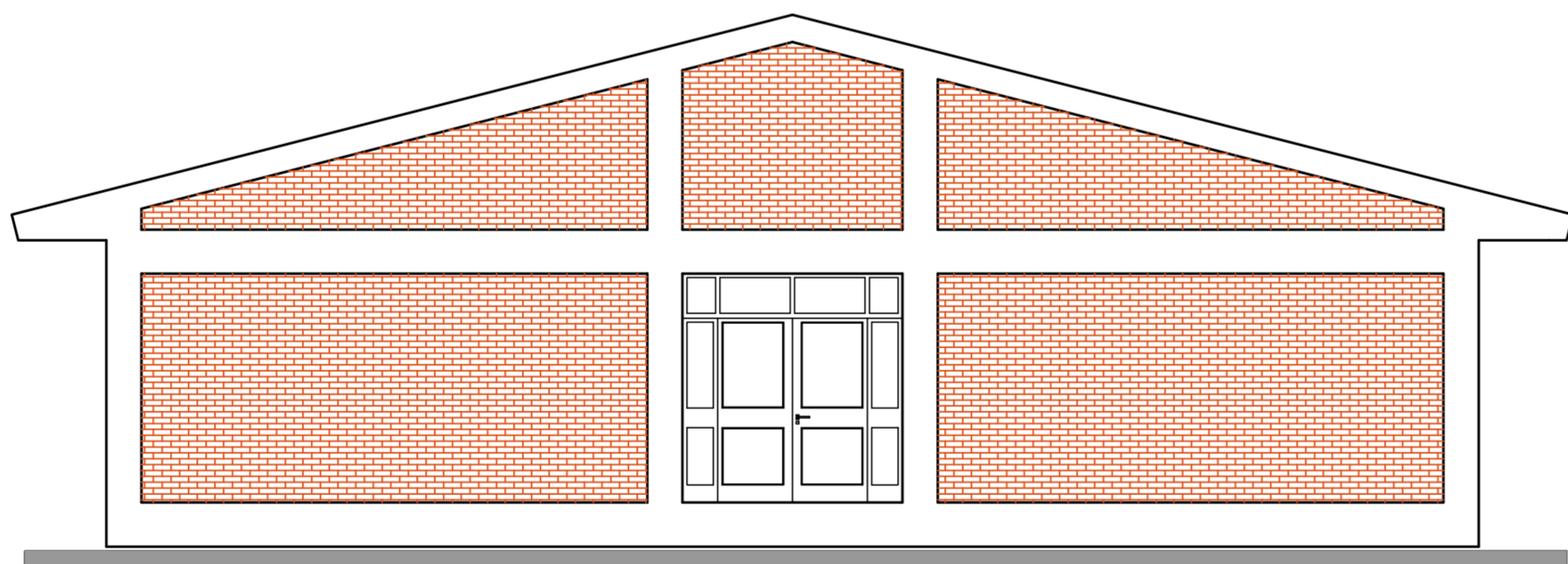
FACHADA LATERAL ESCALA: 1/75